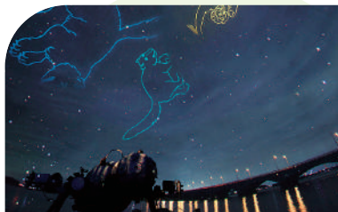
水の館 プラネタリウム

自然豊かな手賀沼畔にある、市民の憩いの場。水に親しむ機会を通して、手賀沼の水環境保全の大切さを感じることができます。じゃぶじゃぶ池は小さな子どもに人気の夏休み限定の水遊び施設です。 ●我孫子市高野山新田193 ☎04-7184-0555 (「水の館」内)