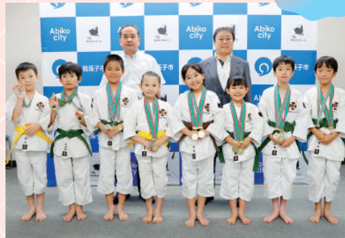
2023年10月、「2023年少林寺拳法世界大会 in Tokyo, Japan」に千葉県代表として出場。大会には約40カ国、2700人が参加