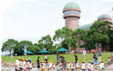
手賀沼親水広場・水の館

自然豊かな手賀沼畔にある、市民の憩いの場。水に親しむ機会を通して、手賀沼の水環境保全の大切さを感じることができます。じゃぶじゃぶ池は小さな子どもに人気の夏休み限定の水遊び施設です。 ●我孫子市高野山新田193 ☎04-7184-0555 (「水の館」内)