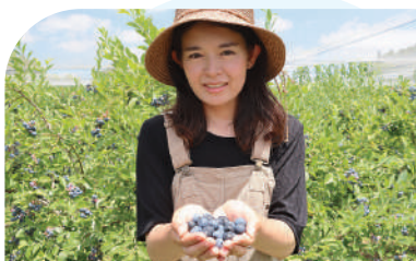
あびこブルーベリーガーデン

我孫子の地産地消の拠点。地元産の旬の野菜がずらりと並びます。どれも採れたてで鮮度は抜群。安全・安心に配慮した農産物や手作り惣菜などがそろっています。 ●我孫子市高野山新田193 (「水の館」内) ☎04-7168-0821 https://www.abiko831.jp/