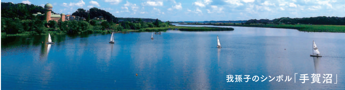
我孫子のシンボル「手賀沼」

手賀沼の雄大な自然に引かれ住み替えた人は数知れず。周辺の施設やアクティビティは、多くの家族連れでにぎわっています。